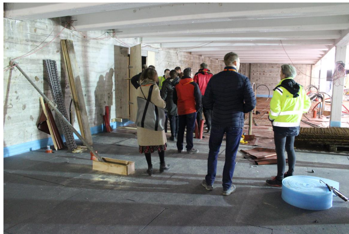
Billeder fra kælderen, der nyindrettes til kantine for bygningens medarbejdere.